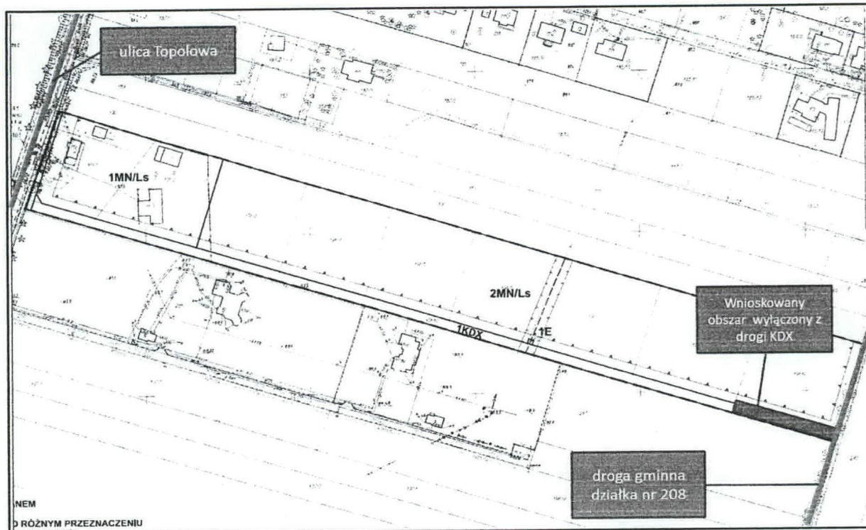
Rysunek 1 (Wniosek 1)